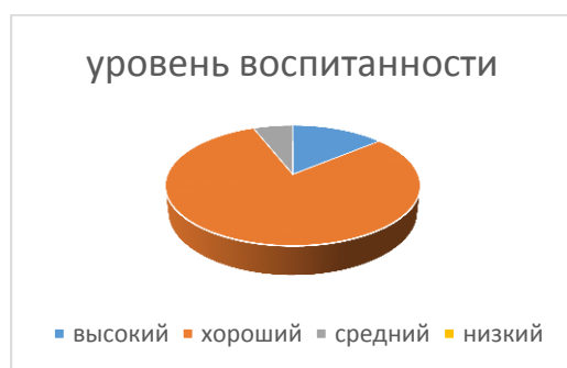
Рис.1 Уровень воспитанности обучающихся школы с. Казарка

Изучение воспитанности школьников осуществлялось с учётом их возрастных особенностей. Оно показало: высокий и хороший уровень воспитанности наблюдается у большинства (14% и 80%) обучающихся школы – это дети, у которых есть наличие устойчивой и положительной самостоятельности в деятельности и поведении наряду с проявлением активной общественной, гражданской позиции (рис.1).